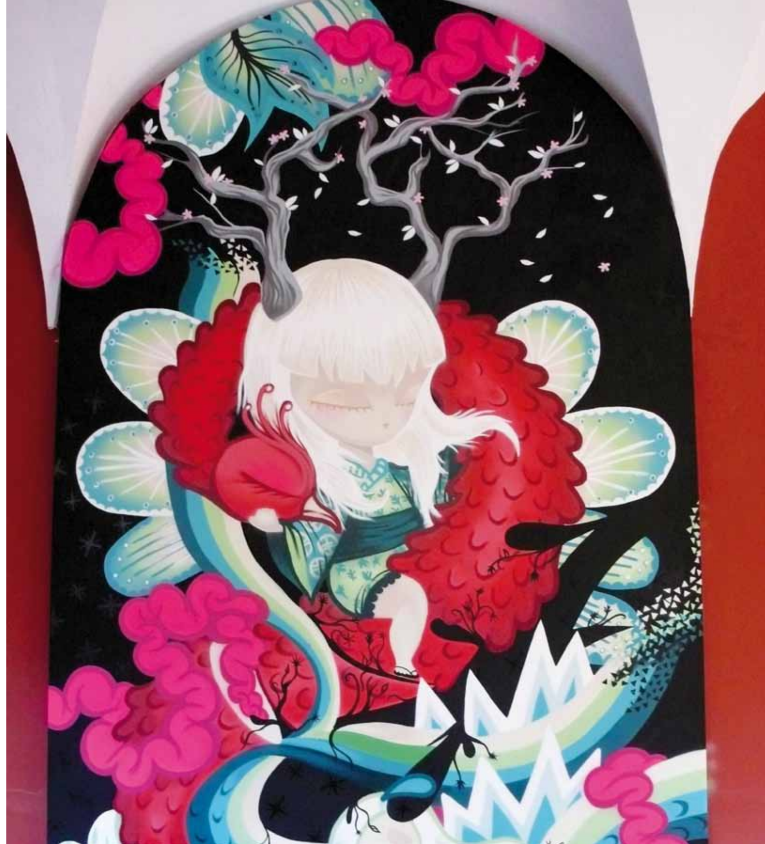
"Quan els segons es converteixen en minuts que es converteixen en hores eternes". 565x281 cm. Exposició Cartografias de la Creatividad 100% Valencianos. El Centre del Carme. València. 2010

En el mundo del graffiti existe una retroalimentación entre los artistas y las diferentes disciplinas que trabajan, hoy en día el uso de internet les acerca con inmediatez y facilita el traslado de artistas, ya no solo a otras comunidades dentro del mismo país sino internacionalmente. Cuando un artista de arte urbano o graffiti quiere marchar a cualquier lugar para pintar en la calle, informa a la comunidad de graffiti del lugar, que en muchas ocasiones no solo irá a pintar con él sino que le aconsejará las zonas en las que debe hacerlo e incluso le acogerá en sus