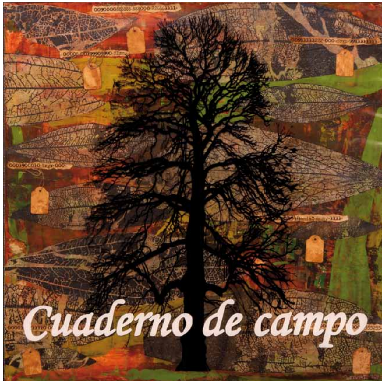
CUADERNO DE CAMPO. 60 x 60 cm