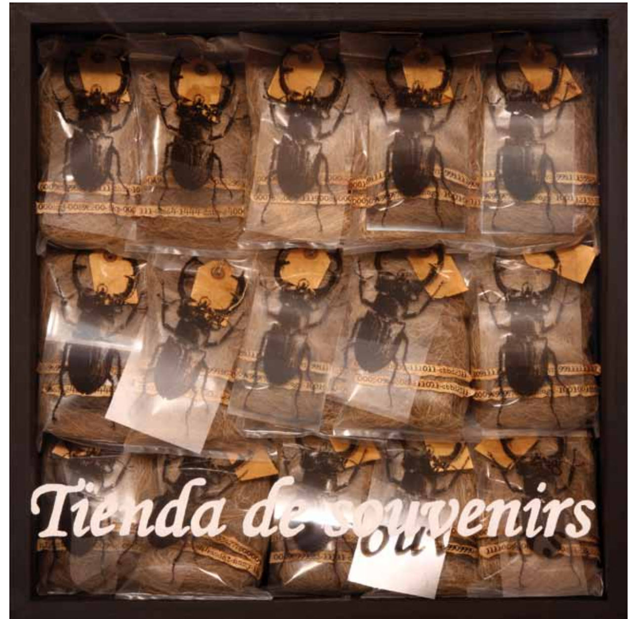
TIENDA DE SOUVENIRS. 60 x 60 cm