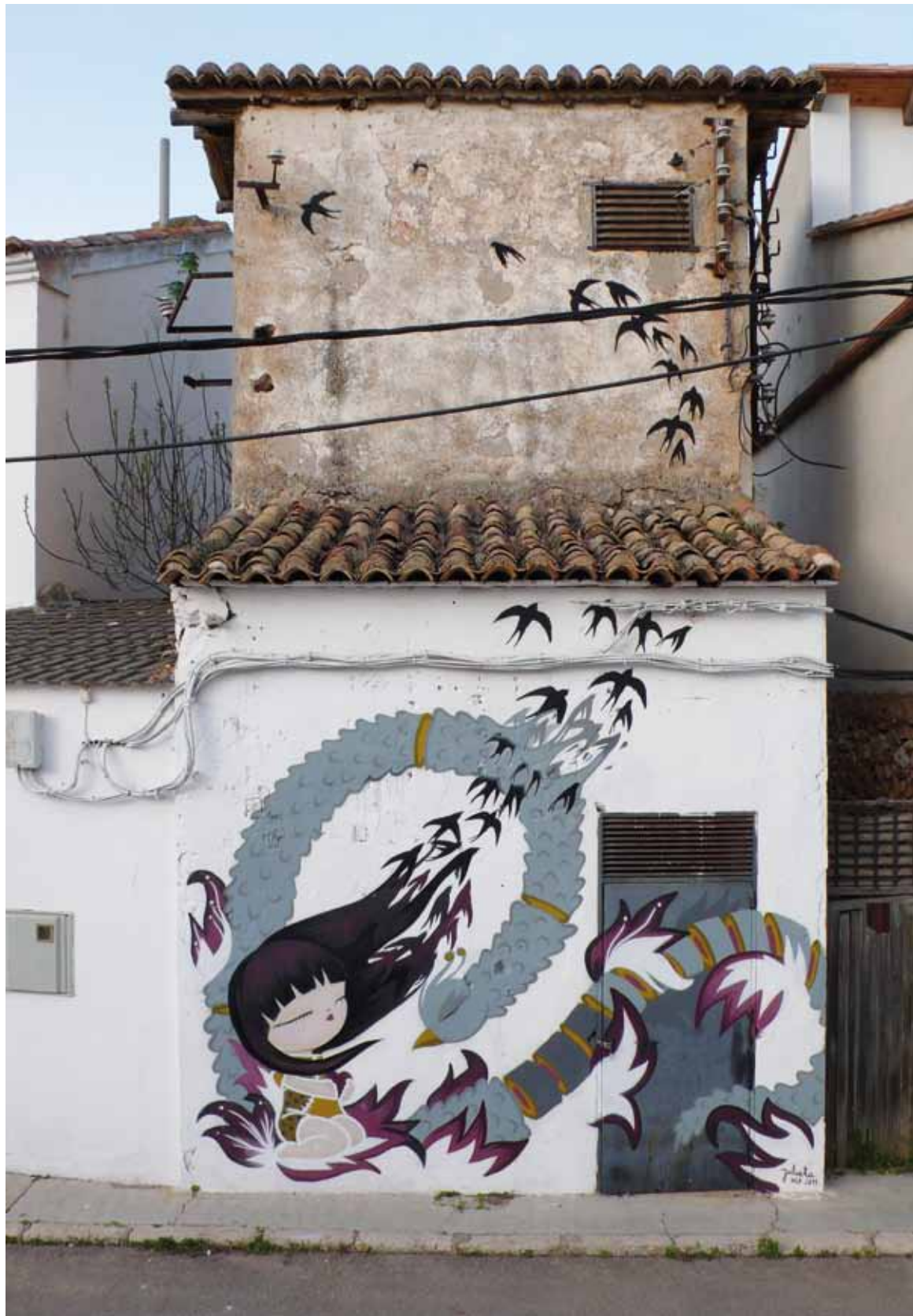
1a Biennial d'Art Urbà de Xera (València). 2011

la comunitat de grafit del lloc, que moltes vegades no sols anirà a pintar amb ell sinó que li aconsellarà les zones on ha de fer-ho i fins i tot l'acollirà en les seues cases. D'aquesta manera podem entendre Banksy, hi ha obra seua per diferents continents, sent londinenc és un dels més buscats per la policia però si les comunitats de grafit actuen així, la cobertura que té Banksy és infinitament superior a les ganes de la policia per agafar-lo.