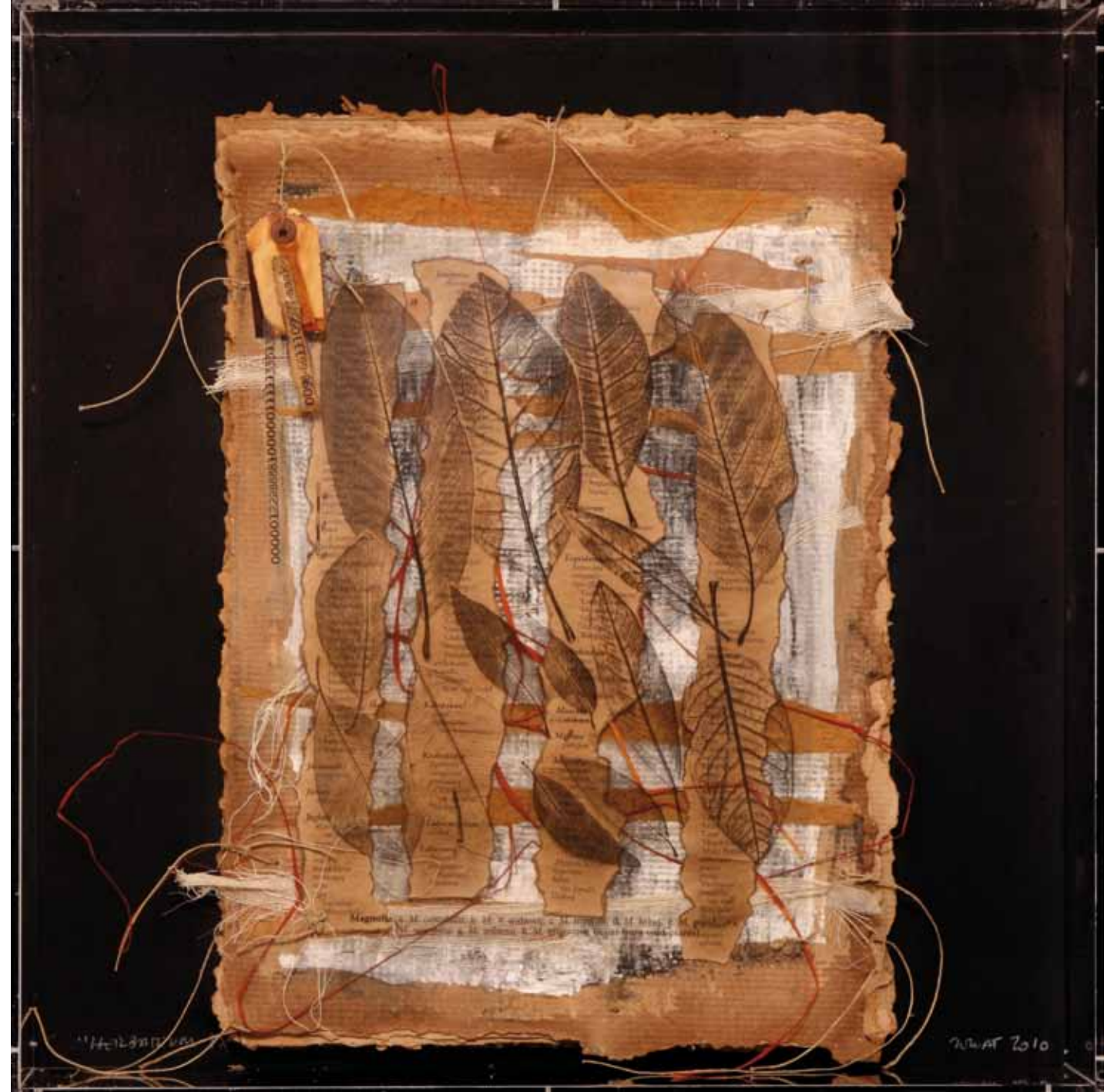
HERBARIUM. Urnes de metacrilat de 60 x 60 cm (plecs de paper fet a mà, acetat, acrílic, corda...)