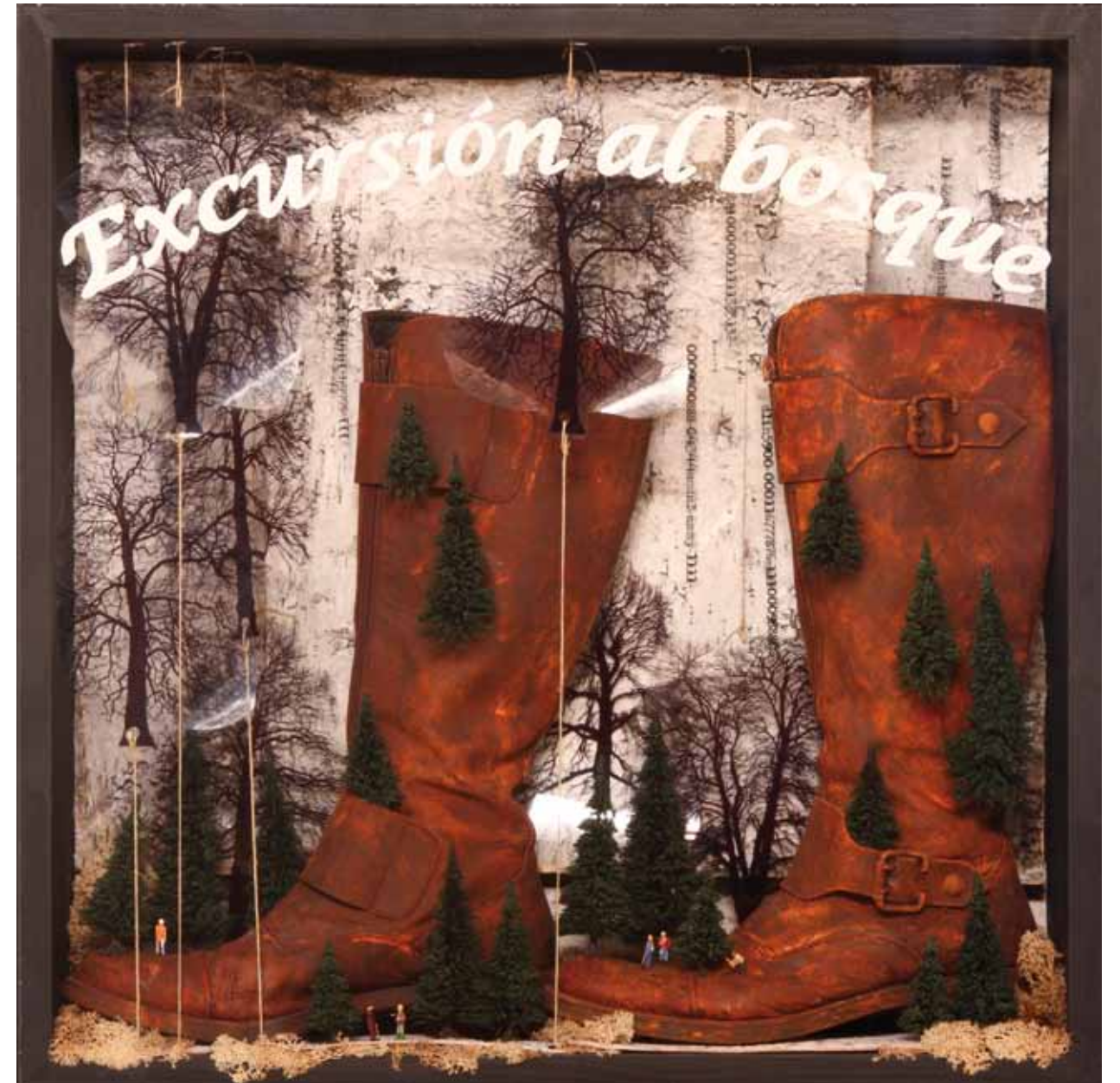
EXCURSIÓN AL BOSQUE. 60 x 60 cm