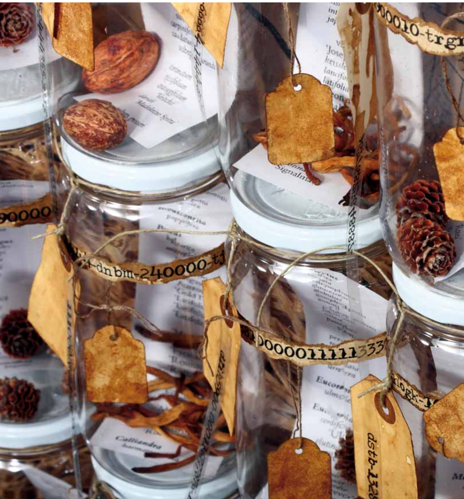
BANCO DE SEMILLAS. 3 urnes de 200 x 150 cm (pots transparents, llavors, fruits, paper, acetat, corda...)