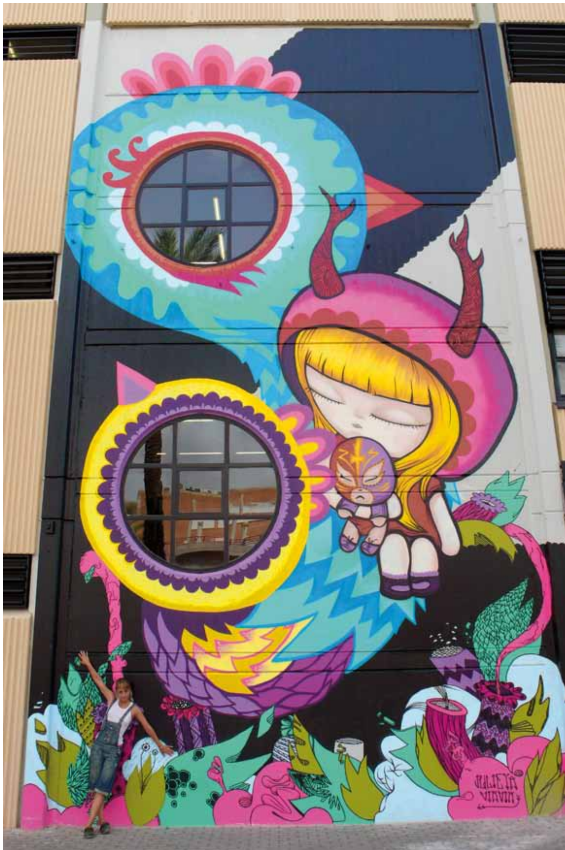
Festival d'Art Urbà Poliniza.Universitat Politècnica. València. 2008