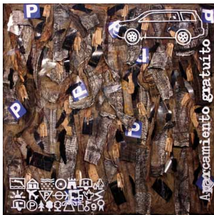
VESTIRSE DE NATURALEZA II. (Ràfia tintada, mantellina de palmàcia, escorça d'arbre, pèl sintètic, acetat, corda, paper, arrels...) VESTIRSE DE NATURALEZA III. (Ràfia, bolets, acetat, arrels, molsa, paper, corda...)