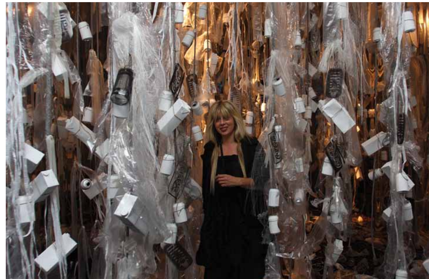
BOSQUE DE BASURA. Mesures variables. (Plàstics, llandes, envasos tetrapack, acetat, corda, paper, ferralla...)