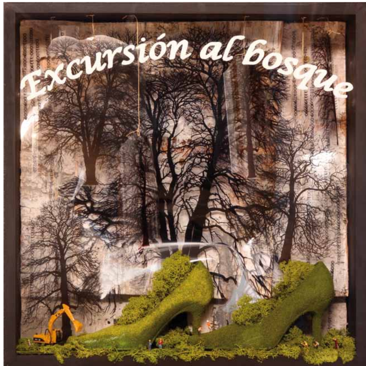
EXCURSIÓN AL BOSQUE. 60 x 60 cm