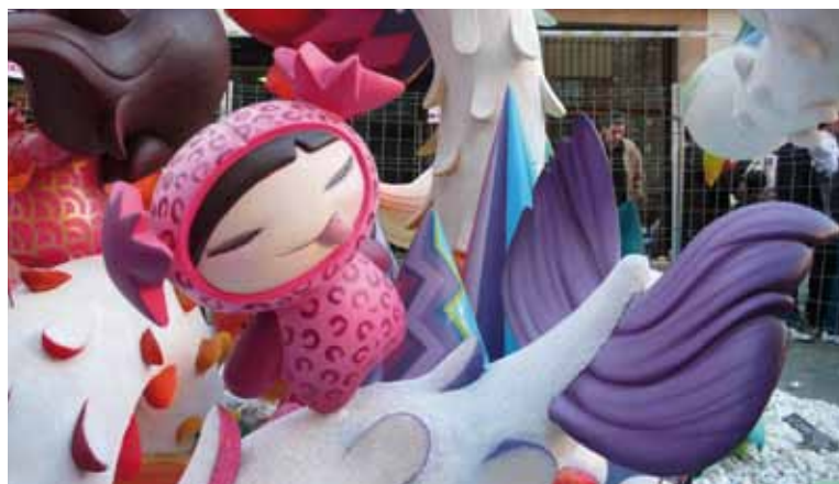
Disseny i pintura aplicats a escultura per a falles. Modelatge en col·laboració amb Miguel Hernández. València. 2011

BERTI, Gabriella: Pioneros del graffiti en España . Universitat Politècnica de València. Servei de Publicacions, 2009.