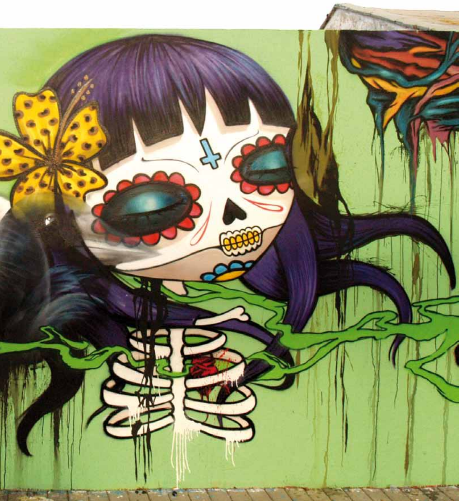
“Muertita”. Festival d’Art Urbà Xekin Canet d’en Berenguer (València). 2011

tremend desequilibri existent en aquesta interrelació, hauríem de reconciliar-nos amb l’entorn i respectar la diversitat a tot arreu.